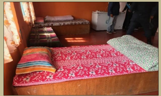
रुपा गाउँपालिकाबाट सञ्चालित क्वारेन्टाइन कक्ष