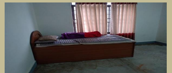
पोखरा म.न.पा.मा सञ्चालित क्वारेन्टाइन कक्ष