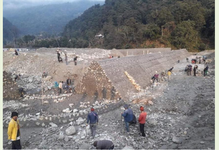
कार्य सहजिकरण पश्चात सुचारु भएको पोखरा महानगरपालिका वडा नं २४ स्थित सिलट्रेसन ड्याममा काम गर्दै मजदुरहरु

कोरोना भाइरस को संक्रमण रोकथाम तथा नियन्त्रणका लागि नेपाल सरकारबाट जारी भएको देशव्यापी लकडाउनको आदेश पश्चात रोकिएका कास्की जिल्ला भित्रका राष्ट्रिय गौरवका आयोजना तथा प्राथमिकता प्राप्त योजना/आयोजना र अन्य निर्माण कार्य मध्ये तत्काल निर्माण कार्य सञ्चालन नगरिएमा ठूलो आर्थिक तथा सामाजिक क्षति हुने सम्भावना रहेका योजना तथा आयोजनाका निर्माण कार्यहरुलाई क्रमशः अगाडि बढाउन सहजिकरण गरिएको छ ।