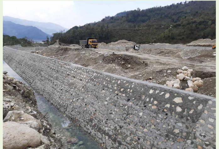
कार्य सहजिकरण पश्चात सुचारु भएको पोखरा महानगरपालिका वडा नं २४ स्थित सिलट्रेसन ड्याम

यस्ता निर्माण कार्य सञ्चालन गर्दा नेपाल सरकारबाट तोकिए बमोजिमका स्वास्थ्य सुरक्षाका उपायहरु (मास्क, सेनिटाइजर, हेडगेयर, पञ्जा, बुट लगाउने) अबलम्बन गर्ने, मजदुर तथा जनशक्तिलाई सामाजिक दुरी (१.५ मिटर) कायम गर्ने, निर्माण स्थलमा अनिवार्य रुपमा खाने, वस्ने तथा पिउने पानी तथा दिवा खाजा र शौचालय तथा कोभिड-१९ (कोरोना भाइरस) को संक्रमण रोकथाम तथा नियन्त्रणका लागि अबलम्बन गर्नु पर्ने भनि तोकिएका अन्य पूर्व सावधानीका उपायहरु समेतको व्यवस्था सम्बन्धित निर्माण व्यवसायी वा निर्माण धनीले मिलाउने गरी सञ्चालन गर्न आवश्यक सहजिकरण भईरहेको छ ।