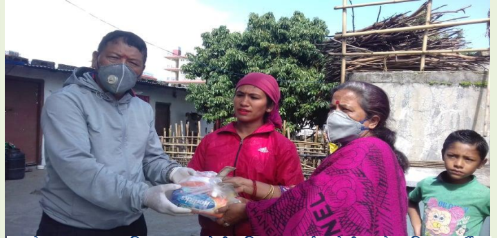
पोखरा महानगरपालिकाबाट सुत्केरी महिलाहरुलाई सुत्केरी प्याकेज वितरण गर्दै जनप्रतिनिधिहरु

तपाईं हामी सबै मिलेर कोरोना भाइरसविरुद्ध लड्न सक्छौं ।