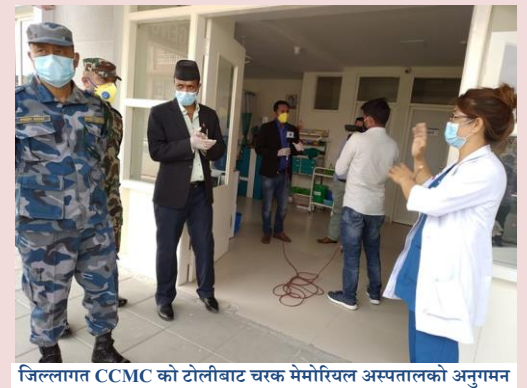
जिल्लागत CCMC को टोलीबाट चरक मेमोरियल अस्पतालको अनुगमन

लागि आवश्यक निर्देशन हुँदा तत्काल सुधार भई सेवा सुचारु भएको छ ।