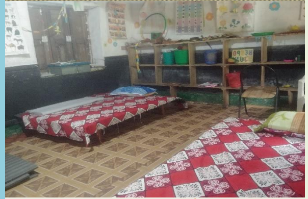
मादी गा.पा.मा सञ्चालित क्वारेन्टाइन स्थल

Travel History थाहा नभएका बेवारिसे, अलपत्र र जोखिमपूर्ण अवस्थामा कास्की जिल्लाभित्र भेटिएका मानिसहरूको RDT र आवश्यकता अनुसार PCR परिक्षण गरेर मात्र पोखरा महानगरपालिकाले व्यवस्थापन गरेका क्वारेन्टाइन कक्षहरूमा राख्ने तथा यस्ता मानिसहरूको PCR परिक्षण पोखरा स्वास्थ्य विज्ञान प्रतिष्ठानले गर्ने व्यवस्था मिलाइएको छ ।