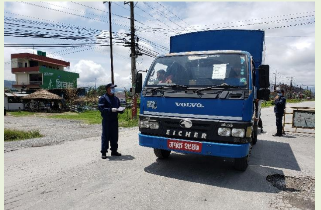
मझुवा नाकाबाट जिल्ला प्रवेश गर्ने सवारी साधनको चेकजाँच गर्दै सुरक्षाकर्मीहरू

जिल्लामा नागरिकहरूको सुरक्षा व्यवस्था तथा दैनिक उपभोग्य वस्तुहरूको आपूर्ति व्यवस्थापनलाई थप प्रभावकारी बनाउन कास्की जिल्ला प्रवेश गर्ने विभिन्न नाकाहरूबाट भित्रिएका सवारी साधन, सवार यात्रु, पैदल यात्रुहरू र सवारी साधनबाट ढुवानी भई आउने खाद्यान्न (चामल, दाल, तेल लगायत दैनिक उपभोग्य वस्तुहरू आदि), तरकारी फलफुल तथा मासुजन्य पदार्थ लगायतका अत्यावश्यक वस्तुहरूको परिमाण तथा यात्रुहरूको संख्या, यात्राको शुरुवाती विन्दु र गन्तव्य स्थल सहितको अभिलेख तयार गर्ने कार्यको थालनी भएको छ ।