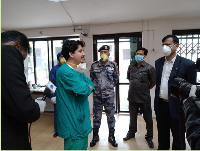
जिल्लागत CCMC को टोलीबाट मातृशिशु मितेरी अस्पतालको अनुगमन

कोभिड-१९ (कोरोना भाइरस) बाट संक्रमित विरामी लगायत अन्य विरामीहरूलाई उपचार नगरी जिम्मेवारीबाट उम्कन खोज्ने स्वास्थ्य संस्था र स्वास्थ्यकर्मीहरूलाई संक्रामक रोग ऐन, २०२० को दफा ३ बमोजिम कानूनी कारवाही हुने व्यवस्थालाई कडाईका साथ कार्यान्वयन गरिएको छ ।