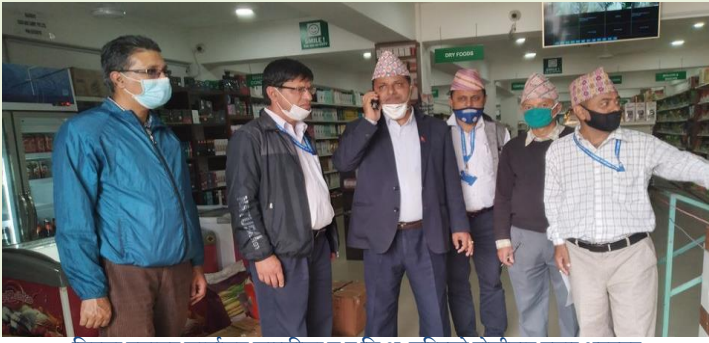
जिल्ला प्रशासन कार्यालय कास्कीका स.प्र.जि.अ. सहितको टोलीबाट बजार अनुगमन

अनुगमनको क्रममा त्यस्ता वस्तुहरू तथा सेवाहरूको उपलब्धता, विक्री वितरण जस्ता पक्षहरूमा देखिएका कमि कमजोरीहरूलाई तत्काल सुधार गर्नको लागि आवश्यक सल्लाह, सुझाव र निर्देशन दिई कोभिड-१९ संक्रमणको यस्तो विषम परिस्थितिमा एकाधिकार, कालोबजारी तथा मिलेमतो जस्ता गैरकानूनी कामकारबाहीलाई कास्की जिल्लाभित्र निषेध गर्नका लागि विभिन्न समयमा यस कार्यालयबाट आदेश तथा सूचनाहरू समेत जारी भएका छन्। बजार तथा बजारसँग सम्बन्धित अन्य विषयहरूको सम्बन्धमा यस कार्यालयमा प्राप्त हुने उजुरी एवं गुनासोहरूलाई प्राथमिकताका साथ फर्स्यौट गरी उपभोक्ता सन्तुष्टि कायम गर्नतर्फ यस कार्यालय अग्रसर रहिआएको छ।