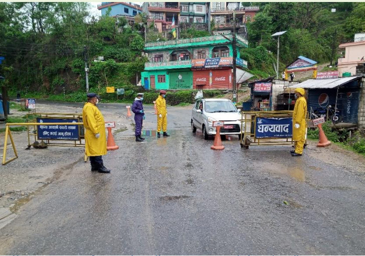
छोरेपाटन नाकाबाट जिल्ला प्रवेश गर्ने सवारी साधनहरूको चेकजाँच गर्दै सुरक्षाकर्मीहरू

मालवाहक सवारी साधनहरूलाई मालसामान ढुवानी गरी फर्कि जाने क्रममा यात्रुलाई ओसारपसार गर्न नपाउने व्यवस्थाको कडाईका साथ कार्यान्वयन गर्न जिल्लास्थित सुरक्षा निकायहरूले आपसी समन्वयमा चेकजाँचको व्यवस्था लाई तिव्रता दिईएको छ ।