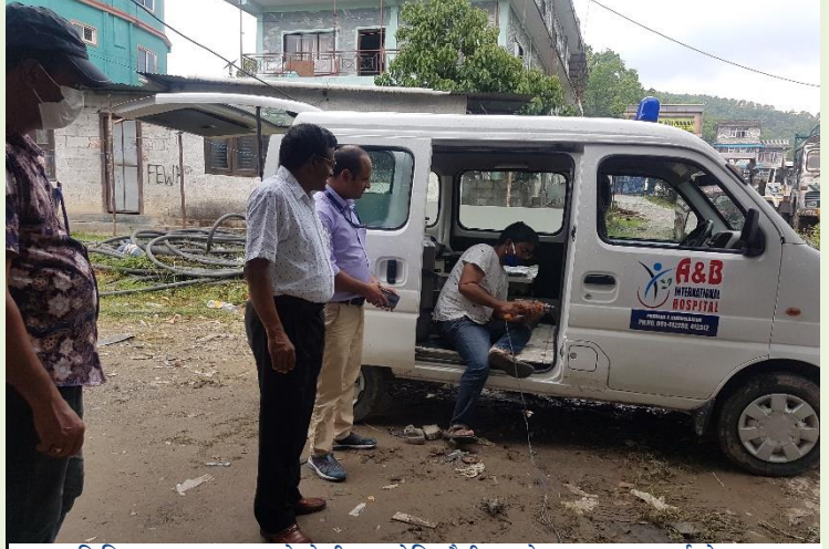
कास्की जिल्लागत CCMC को टोलीबाट कोभिडमैत्री एम्बुलेन्स रुपान्तरण कार्यको अनुगमन

जिल्लाभर कहि कतै बाट कोरोना भाइरसको संक्रमित व्यक्तिहरूको सूचना प्राप्त भएमा स्वास्थ्य निर्देशनालय गण्डकी प्रदेश स्थित "हेल्लो डाक्टर हटलाइन सेवा (१०९२) मा सम्पर्क गरि त्यस्ता व्यक्तिको स्क्रिनिङ्ग पश्चात तहाँबाट प्राप्त निर्देशन बमोजिम एम्बुलेन्स परिचालनको व्यवस्था मिलाईएको छ । कोभिड-१९ को संक्रमण आशंका तथा संक्रमण पुष्टि भएका व्यक्तिहरूको ओसारपोसारमा संलग्न हुने व्यक्तिहरूले अनिवार्य रूपमा व्यक्तिगत सुरक्षा कवच (PPE) को प्रयोग गर्नुपर्ने व्यवस्था छ । त्यस्तै प्रादेशिक सदरमुकाम रहेको जिल्लामा कम्तीमा ५ वटा एम्बुलेन्सहरूलाई कोभिडमैत्री एम्बुलेन्सको रूपमा तयार गरी तयारी अवस्थामा राख्न कोभिड-१९ संकट व्यवस्थापन केन्द्र, शान्ति सुरक्षा अनुगमन तथा नियन्त्रण कार्य समूहबाट प्राप्त निर्देशन अनुसार COVID-19 Friendly Ambulance बनाउन कास्की जिल्ला स्थित एम्बुलेन्स संचालन समिति, स्वास्थ्य कार्यालय कास्की, नेपाल रेडक्रस सोसाइटी जिल्ला शाखा कास्कीलाई अनुरोध गर्दा जिल्लामा परिचालन भएका जम्मा ४४ वटा एम्बुलेन्सहरूमध्ये २८ वटा एम्बुलेन्स तोकिएको मापदण्ड, Design बमोजिम कोभिडमैत्री एम्बुलेन्सको रूपमा रुपान्तरण भैसकेका छन् भने बाँकि १६ वटा एम्बुलेन्सहरूलाई पनि कोभिडमैत्री बनाउने गरी संरचनामा सुधार गर्ने कार्य जारी छ ।