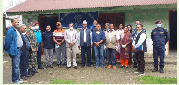
कास्की जिल्लागत CCMC टोलीबाट मादी गाँउपालिका वडा नं ३ स्थित सिताराम मा.वि.मा संचालित क्वारेन्टाइन स्थलको अनुगमन

कास्की जिल्लागत CCMC को टोलीबाट विभिन्न मितिमा कोभिड-१९ को संक्रमण रोकथाम तथा नियन्त्रण व्यवस्थापनका लागि स्थानीय तहहरूबाट सञ्चालित क्वारेन्टाइन स्थलहरूको अनुगमन निरिक्षण भएको छ।