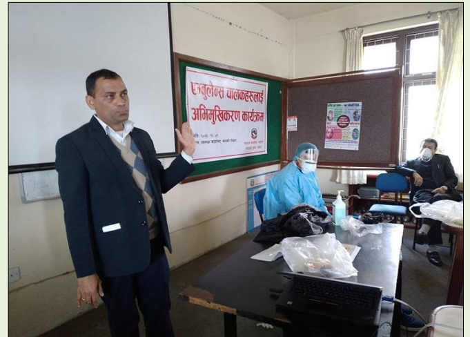
स्वास्थ्य कार्यालय कास्कीको आयोजनामा एम्बुलेन्स चालकहरूलाई अभिमुखिकरण कार्यक्रम

कास्की जिल्लाभित्र परिचालित कोभिड-१९ मैत्री तथा अन्य एम्बुलेन्सका चालकहरूलाई कोभिड-१९ (कोरोना भाइरस) को संक्रमण रोकथाम तथा नियन्त्रणको क्रममा वहन गर्नुपर्ने आफ्नो कर्तव्य एवं जिम्मेवारी तथा अबलम्बन गर्नुपर्ने पूर्व सावधानीका विषयहरूको जानकारी दिने उद्देश्यले अभिमुखिकरण कार्यक्रम सञ्चालन गरियो ।