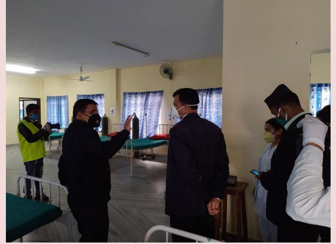
जिल्लागत CCMC को टोलीबाट पोखरा स्वास्थ्य विज्ञान प्रतिष्ठानमा निर्मित आइसोलेशन वार्डको अनुगमन

जिल्ला भित्रका सम्पूर्ण सरकारी, गैह सरकारी, निजी, सामुदायिक क्षेत्र तथा मेडिकल कलेज र प्रतिष्ठानबाट सञ्चालित अस्पताल, प्राथमिक स्वास्थ्य केन्द्र, स्वास्थ्य चौकी तथा स्वास्थ्य संस्थाबाट ओपिडी सेवा बाहेकका आकस्मिक तथा गम्भिर प्रकारका सेवाहरू अत्यावश्यक एवं आधारभूत सेवाहरू र सो सँग सम्बन्धित सबै निरोधात्मक सेवाहरू सूचारु गराउन सबै स्वास्थ्य संस्थाहरूलाई निर्देशन भई उल्लेखित सेवाहरू सुचारु भएको छ र सो को आवश्यकता अनुसार अनुगमन भएको छ ।