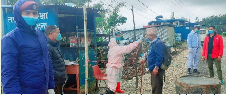
नयाँपुल नाकाबाट जिल्ला प्रवेश गर्ने यात्रुहरूको थर्मल गनबाट ज्वरो चेकजाँच हुदै

मिति २०७६।१२।१४ गते देखि नै जिल्ला प्रवेश गर्ने मुख्य नाका सिद्धार्थ राजमार्गको छोरेपाटन, पोखरा बाग्लुङ राजमार्गको नयाँपुल र पृथ्वी राजमार्गको गगनगौडामा रहेको सुरक्षा चेक पोष्टसँगै पोखरा महानगरपालिकाले स्वास्थ्य उपकरण सहितको हेल्थ डेस्क राख्ने कार्यको सुरुवात भएको छ ।