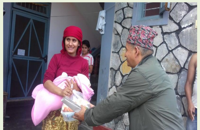
पोखरा महानगरपालिकाबाट सुत्केरी महिलाहरुलाई सुत्केरी प्याकेज उपलब्ध गराउदै जनप्रतिनिधी एवं कर्मचारीहरु